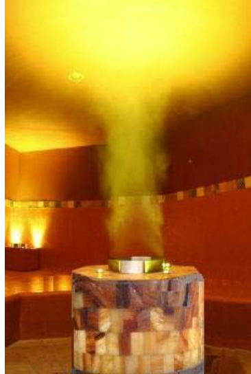
Dampfbad - Ofenverbau